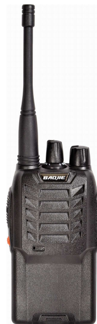
Abbildung eines tragbaren Funkgeräts „Walkie-Talkie“

Nachteil: Bei drahtlosen Netzen sind mehrere Kanäle nötig. Bei drahtgebundenen Netzen ist der Aufwand für die Verkabelung höher.