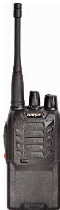
Abbildung eines tragbaren Funkgeräts „Walkie-Talkie“

Nachteil: Bei drahtlosen Netzen sind mehrere Kanäle nötig. Bei drahtgebundenen Netzen ist der Aufwand für die Verkabelung höher.