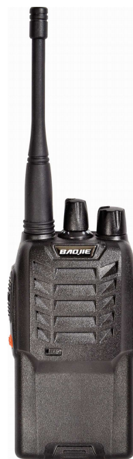
Abbildung eines tragbaren Funkgeräts „Walkie-Talkie“

Nachteil: Bei drahtlosen Netzen sind mehrere Kanäle nötig. Bei drahtgebundenen Netzen ist der Aufwand für die Verkabelung höher.