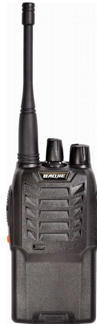
Abbildung eines tragbaren Funkgeräts „Walkie-Talkie“